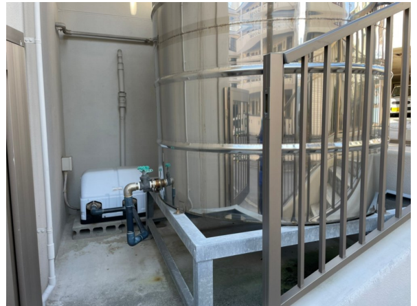
2. 受水槽フェンスまわり