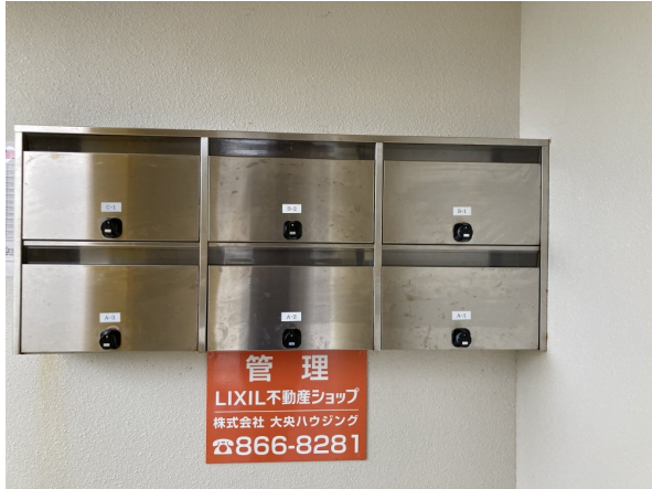
3.集合ポスト・看板