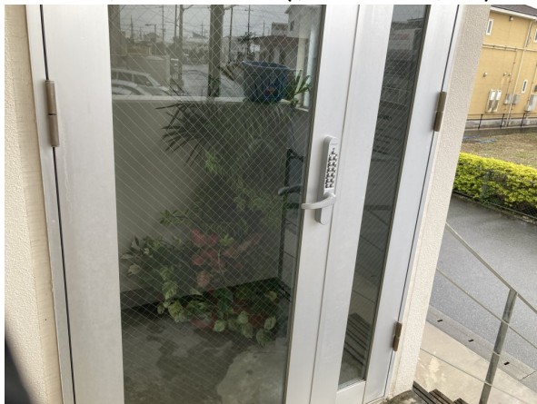
3.エントランスホール（タイル・ガラス）