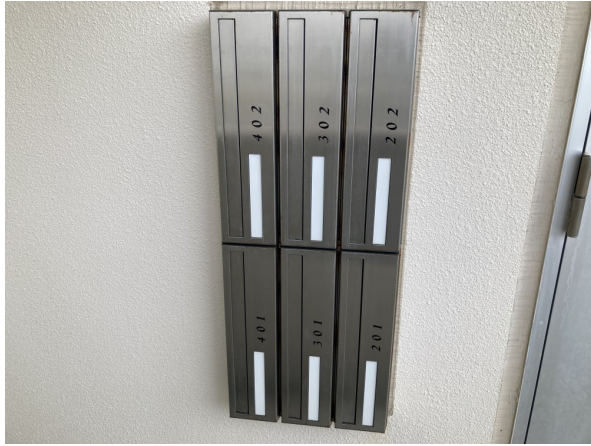
4.集合ポスト・看板