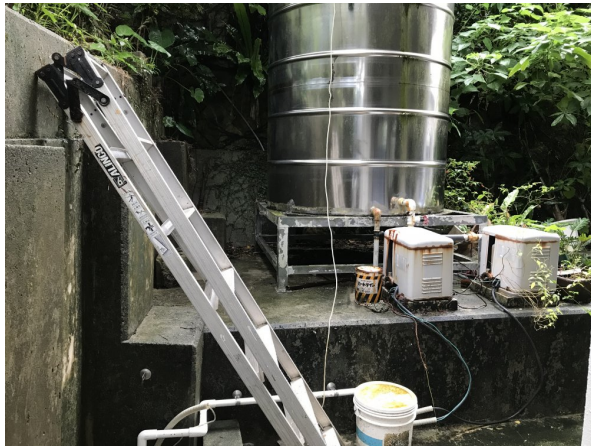
2. 受水槽フェンスまわり