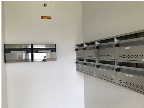
4.集合ポスト・看板