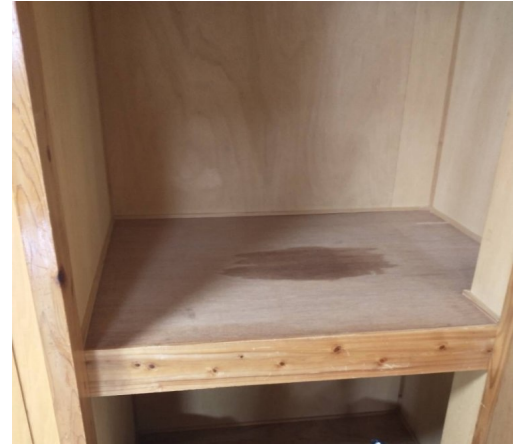
畳部屋の押し入れ シミ有り