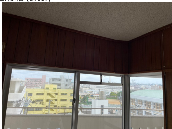
カーテンレール取外し処分