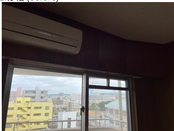
カーテンレール取外しbefore