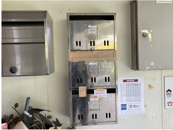
4.集合ポスト・看板