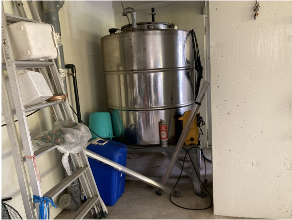
2. 受水槽フェンスまわり