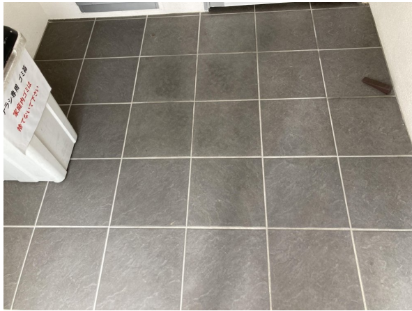
3.エントランスホール（タイル・ガラス）