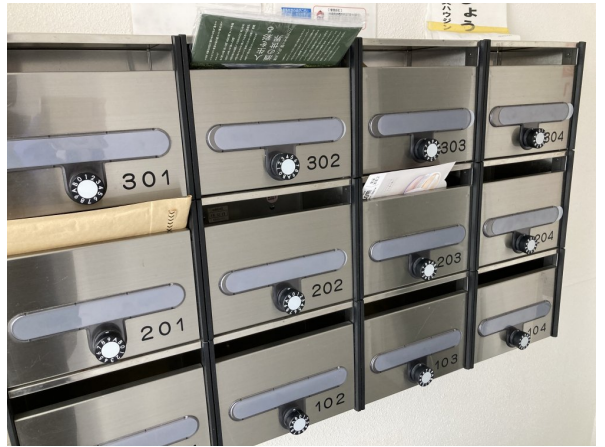
4.集合ポスト・看板