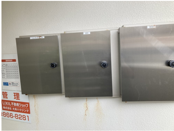
3.集合ポスト・看板