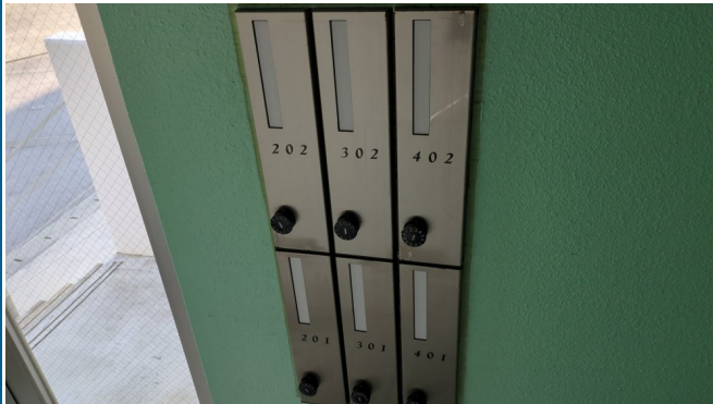
4.集合ポスト・看板