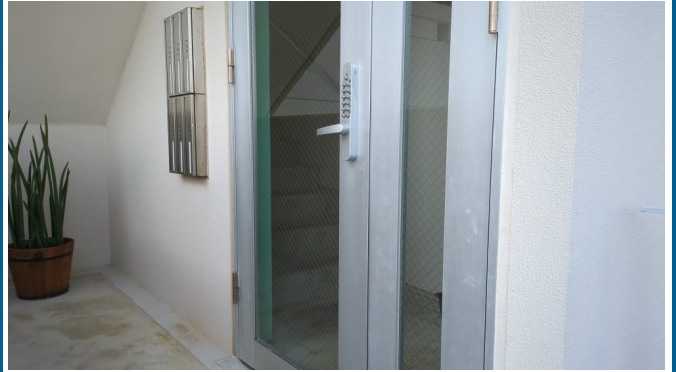
3.エントランスホール（タイル・ガラス）