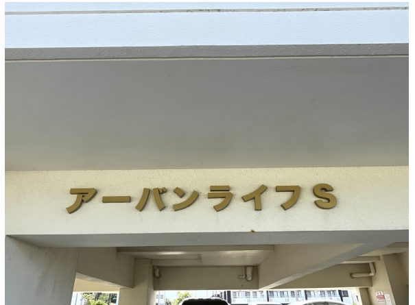
4.集合ポスト・看板