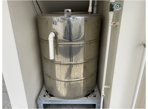
2. 受水槽フェンスまわり