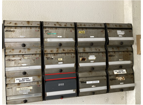
3.集合ポスト・看板