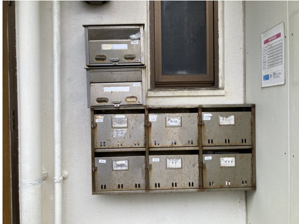
3.集合ポスト・看板