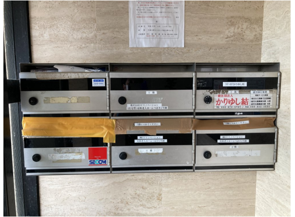
6.集合ポスト・看板