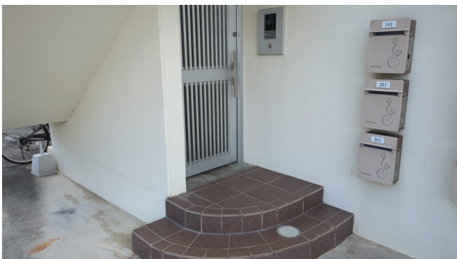
3. エントランスホール（タイル・ガラス）