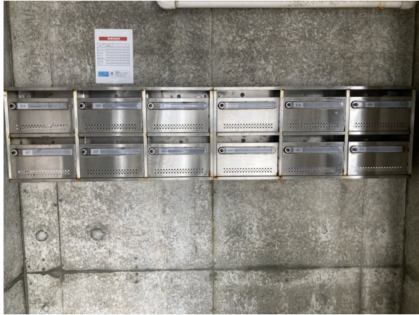
2.集合ポスト・看板