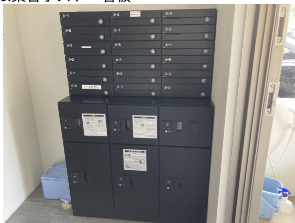
6. 集合ポスト・看板