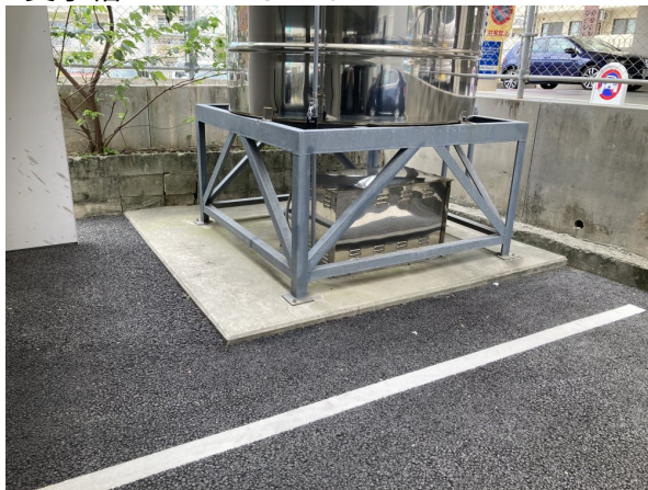
2. 受水槽フェンスまわり