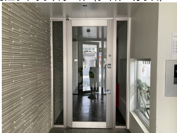
5. エントランスホール (タイル・ガラス)