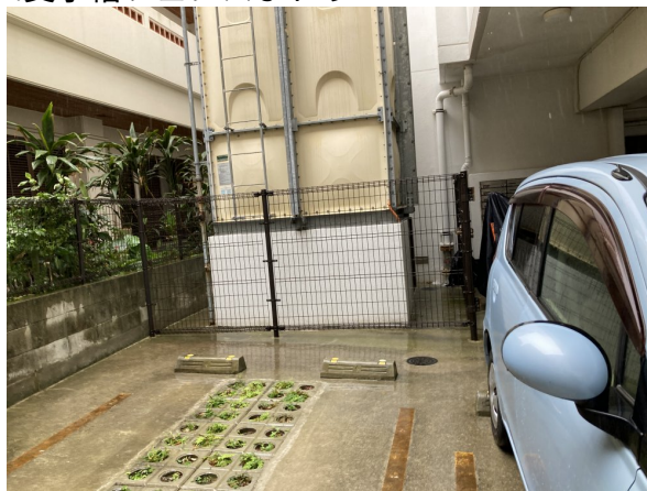
2. 受水槽フェンスまわり