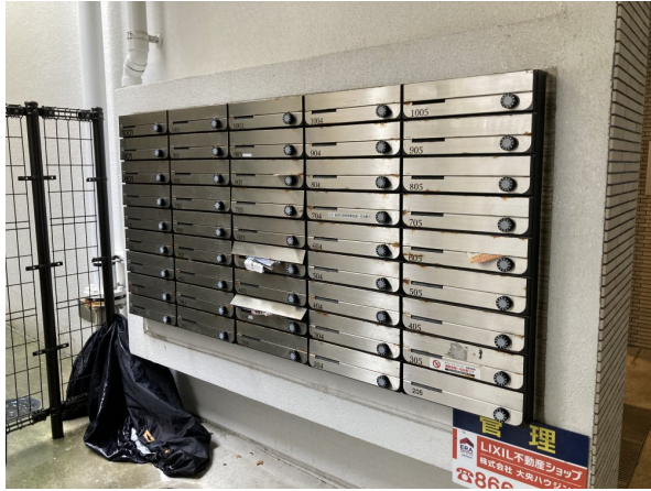
6.集合ポスト・看板