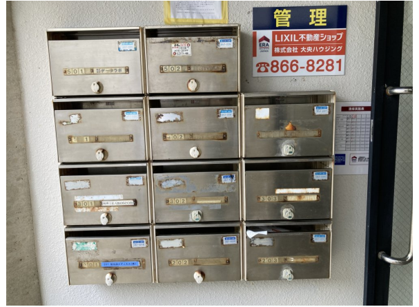
6.集合ポスト・看板