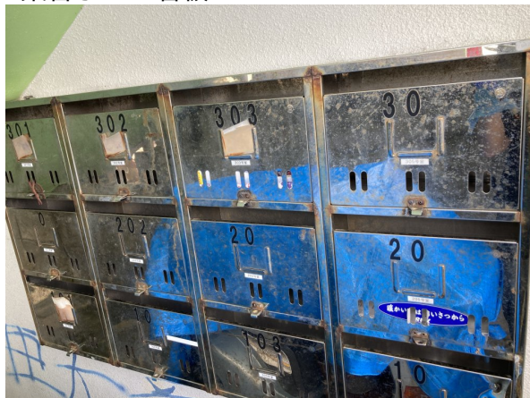
3.集合ポスト・看板