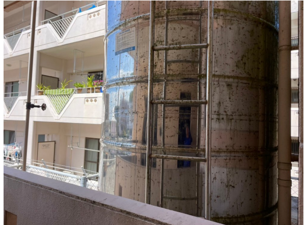
4.受水槽フェンスまわり