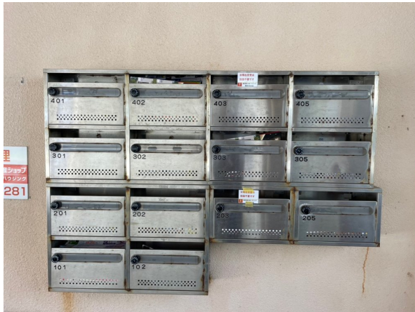
5.集合ポスト・看板