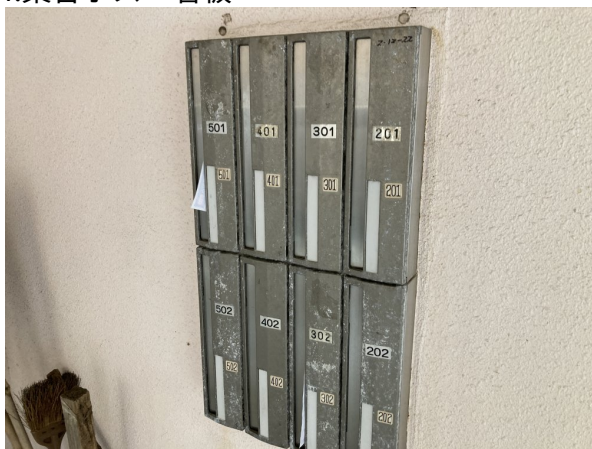
4.集合ポスト・看板