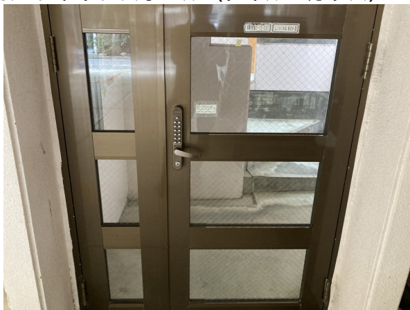
3.エントランスホール（タイル・ガラス）