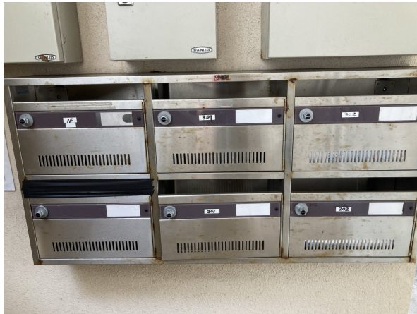
3.集合ポスト・看板