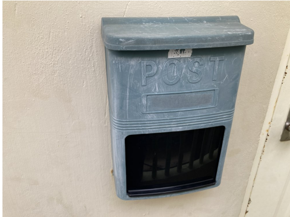
3.集合ポスト・看板