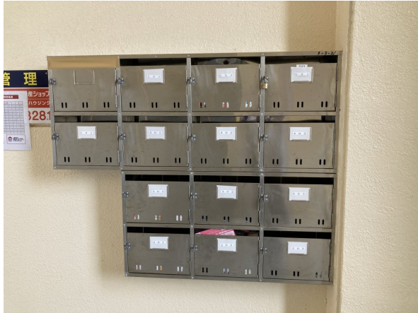
4.集合ポスト・看板