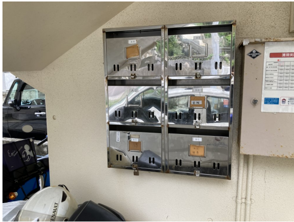
3.集合ポスト・看板