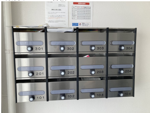
2.集合ポスト・看板