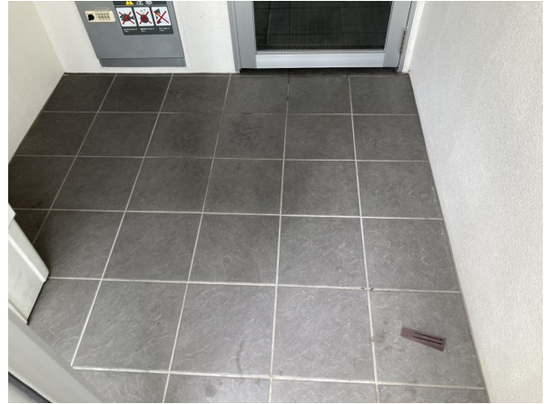
1.エントランスホール（タイル・ガラス）