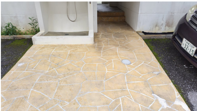
2. エントランスホール (タイル・ガラス)