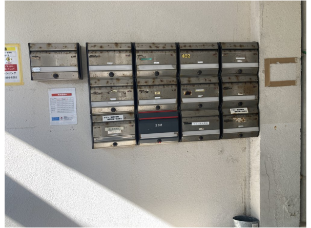
3.集合ポスト・看板