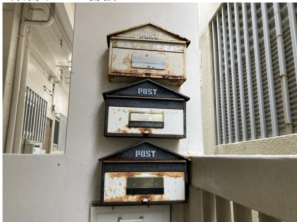
3.集合ポスト・看板