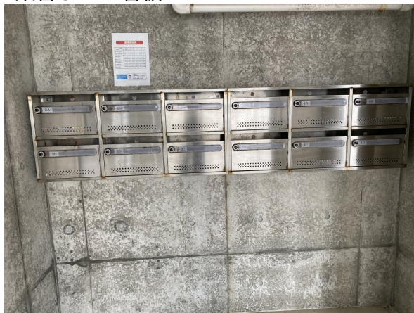
3.集合ポスト・看板