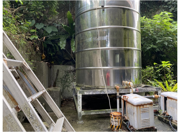
2. 受水槽フェンスまわり