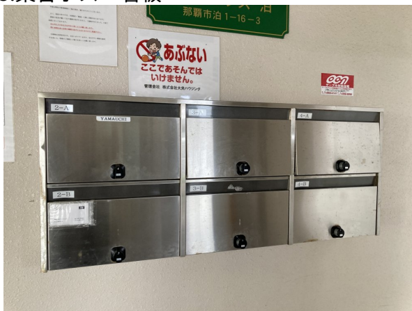
3.集合ポスト・看板