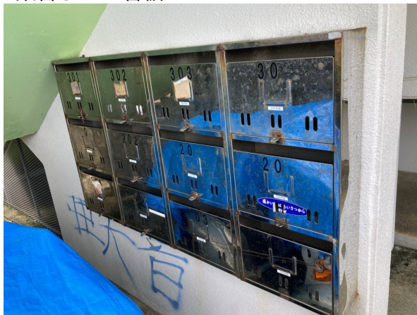
3.集合ポスト・看板