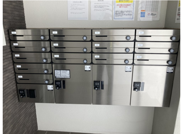
7.集合ポスト・看板