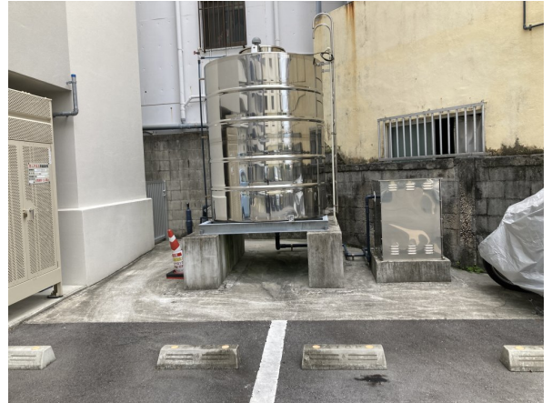
2. 受水槽フェンスまわり