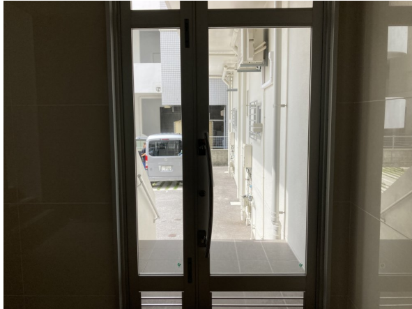
6.エントランスホール（タイル・ガラス）