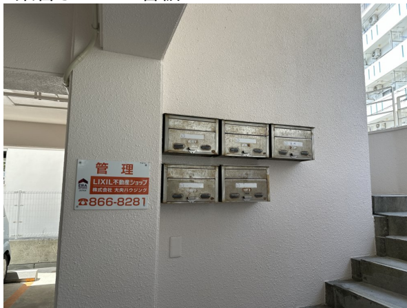
3.集合ポスト・看板