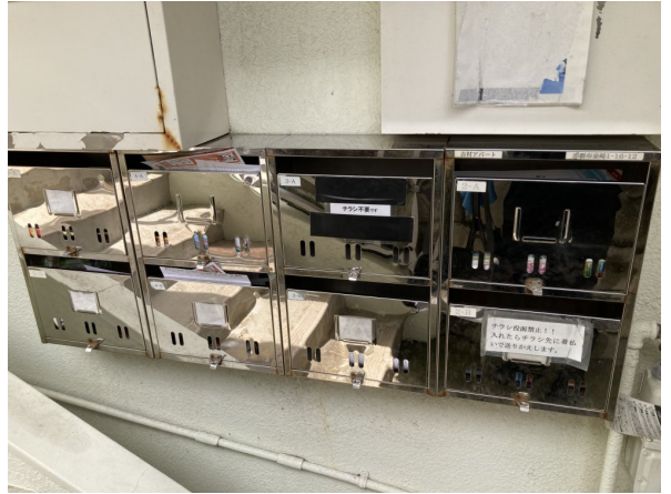
2.集合ポスト・看板