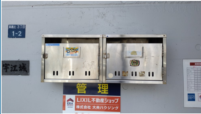
3.集合ポスト・看板