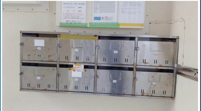
3.集合ポスト・看板