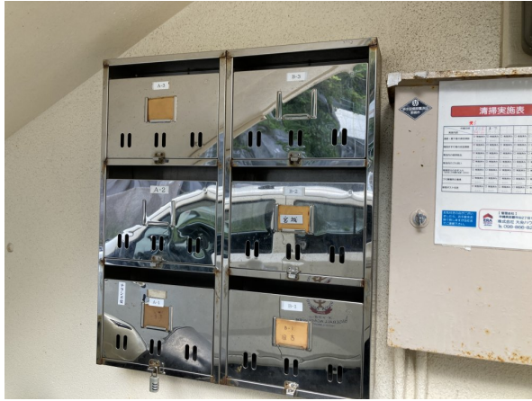
3.集合ポスト・看板