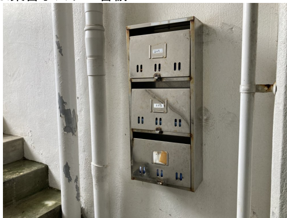
3.集合ポスト・看板