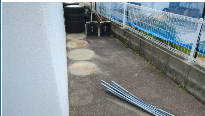
2. 受水槽フェンスまわり