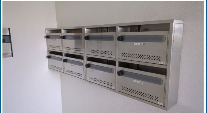
5.集合ポスト・看板