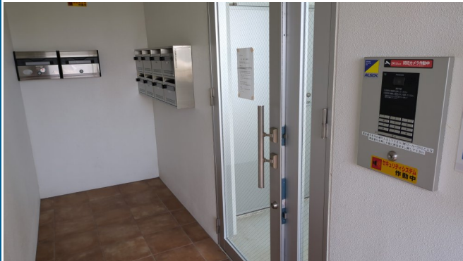
4.エントランスホール（タイル・ガラス）